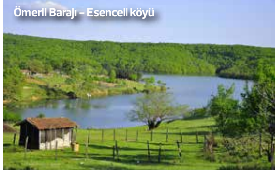
Ömerli Barajı - Esençeli köyü

Esençeli oldukça küçük bir köy. Ömerli Barajı kıyısında sessiz, sakin bir yer. Bostancı'dan 50 km uzaklıkta. Köy etrafında, baraj çevresinde konaklayabilecek, kamp yapılabilecek muhtelif yerler bulmak mümkün. Yürüyüş yapmak, günübirlik geziler, piknik vs. için de oldukça uygun bir lokasyon. Trekking için ideal bir yer. Burası gerçekten yalnız kalabileceğiniz ve kafanızı dinleyebileceğiniz nadir yerlerden biri.